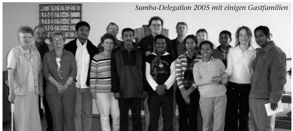
Sumba-Delegation 2005 mit einigen Gastfamilien

Zur weiteren Vorbereitung im Hinblick auf Programm und Unterbringung finden im Januar zwei Treffen statt, zu dem die Missionsvertreter der Gemeinden, der Vorstand des Frauenbundes und alle an der Vorbereitung Interessierten herzlich eingeladen sind: am Montag, 12. Januar 2009 um 20 Uhr in Uelsen für die Ge-