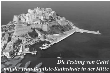
Die Festung von Calvi mit der Jean-Baptiste-Kathedrale in der Mitte

woher er kommt und wohin er fährt. So ist es bei jedem, der aus dem Geist geboren ist.«