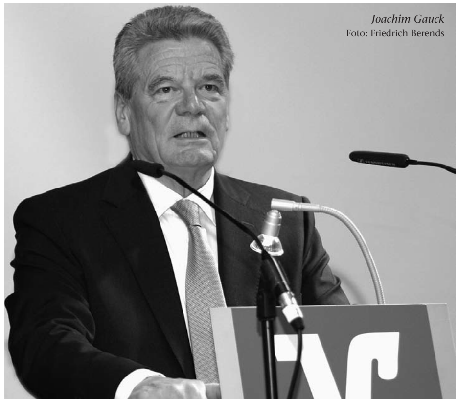
Joachim Gauck

Träume in Erfüllung, auch der, endlich einen »Wartburg« zu fahren. Die Warteliste dafür wäre dann nicht mehr so endlos