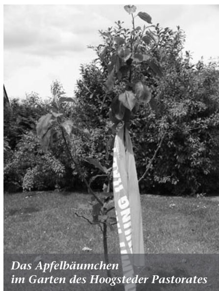
Das Apfelbäumchen im Garten des Hoogsteder Pastorates