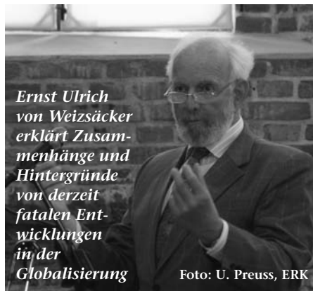
Ernst Ulrich von Weizsäcker erklärt Zusammenhänge und Hintergründe von derzeit fatalen Entwicklungen in der Globalisierung

ten und zwischenzeitliches Mitglied für die SPD im Bundestag kennt er die Mechanismen, die in Politik und Wirtschaft derzeit den Ton angeben. Von Weizsäcker analysierte feinsinnig die philosophischen Strömungen, die hinter der Globalisierung stecken. Er benannte die angelsächsische Richtung, die bei Fundamentalisten in Amerika viele Anhänger findet, demnach die Welt in Gute und Böse zu unterscheiden sei, der Erfolg den Guten Recht gebe und sich deren Segnungen im Konsum nachweisen ließe. In den Markt dürfe nicht eingegriffen werden, denn der Mensch sei ein Egoist, der seine Kräfte durch Konsum zu einem Vorteil für alle einsetzen würde. Nachdem der in deren Au-