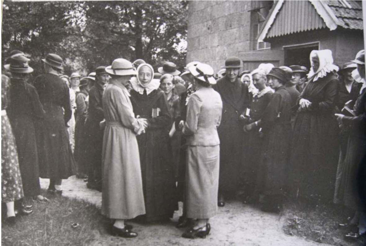
JeurJoh11.jpg Schwarz-weiß Abzug, Rückseite: Vor der Kirche in Hoogstede, Ostern 1950