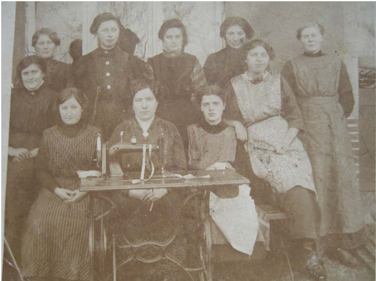
JohJeur04.jpg (= Ausschnitt von JohJeur05.jpg)

Foto von Erna Harms-Ensink, 22.07.06 via Johann Jeurink, sofort retour