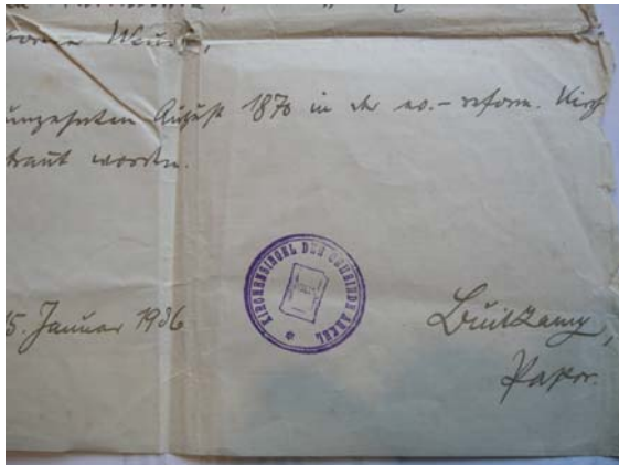
Warme001-004 Unterschrift und Siegel Pastor Buitkamp, 1936