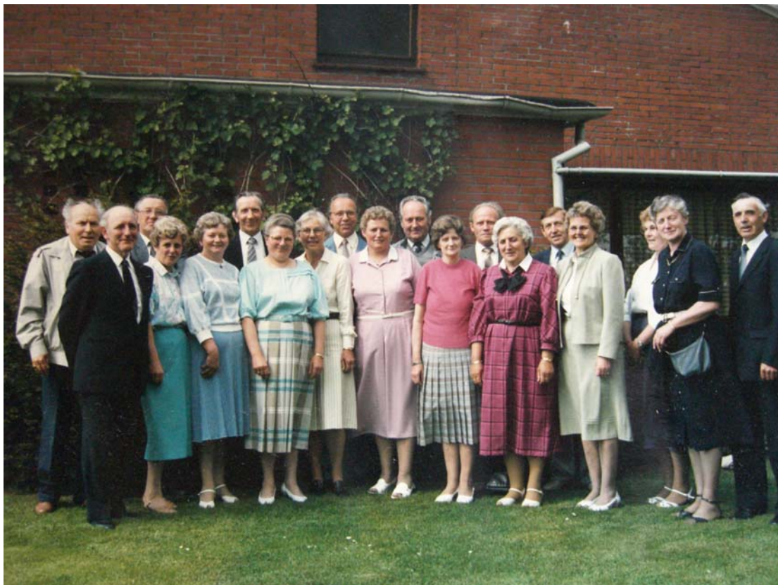
Warmer007 Foto zum Schuljubiläum ca. 2000