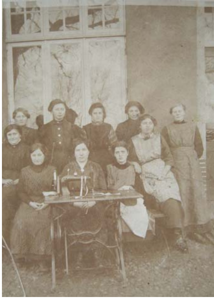
JeurJoh05.jpg (=Übersicht, Gesamtfoto)