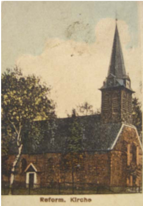
JeurJoh10.jpg (Auszug Postkarte)