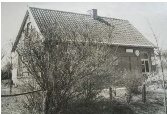
Anderes Geschäft (bei Töller ?) (Büd161.jpgI