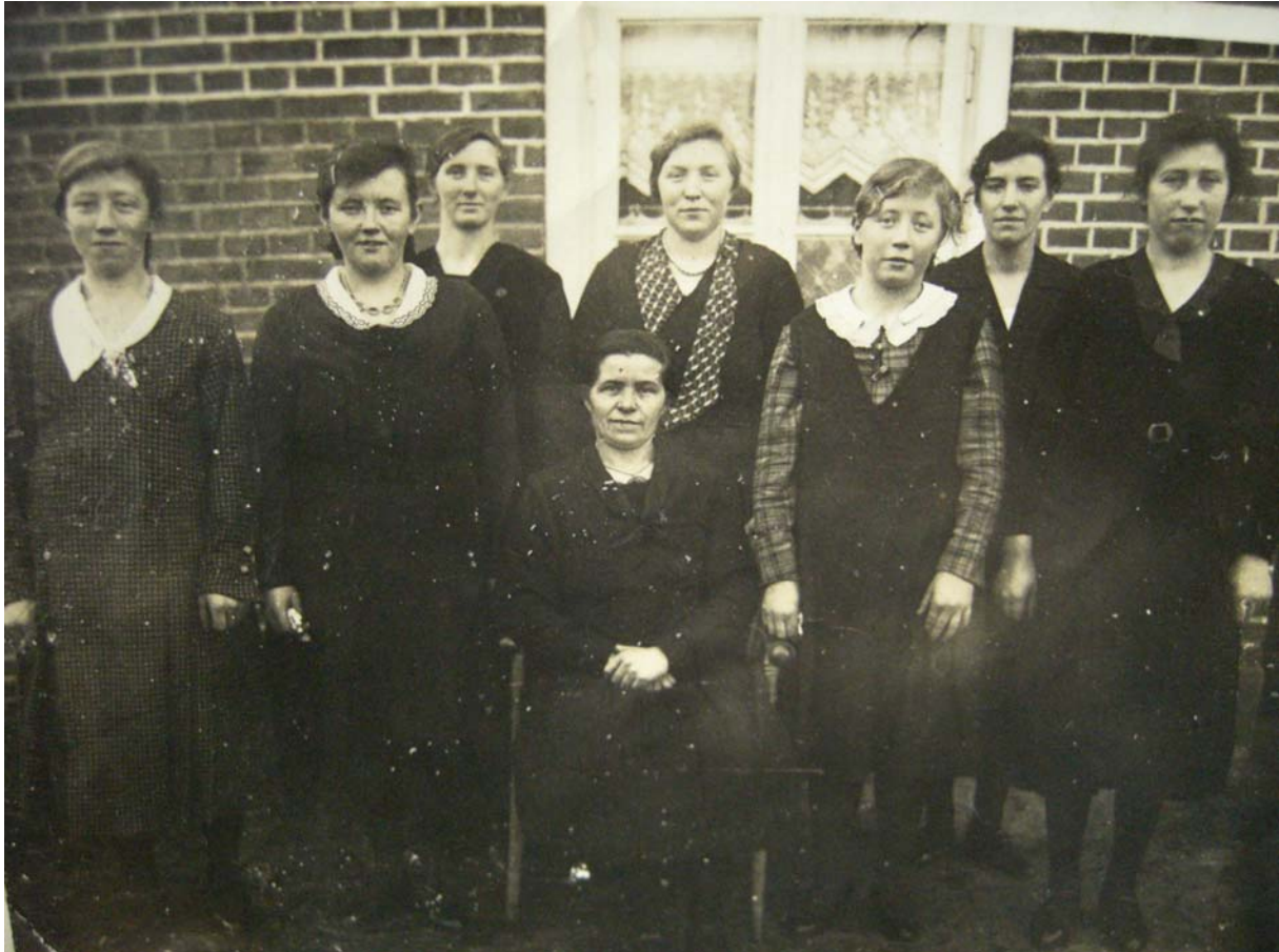
Bud217.jpg Ein Nähkursus, ungefähr in JAHRESZAHL?