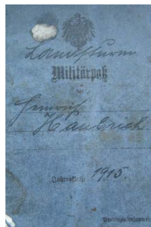
Büd164.jpg Militärpass 1915

„Hufbeschlag Lehrschmiede, Münster 1934“, links VORNAME Schophuis aus Hoogstede