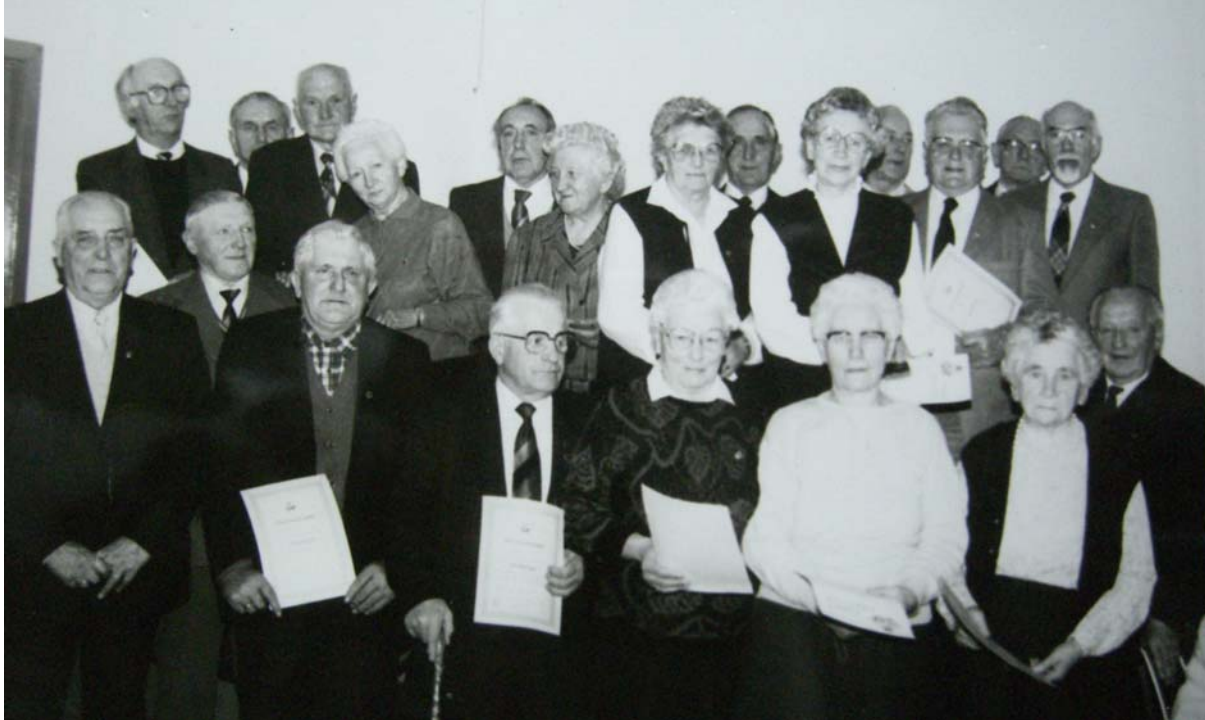
Büd147.jpg vorne v.l. dahinter v.l.