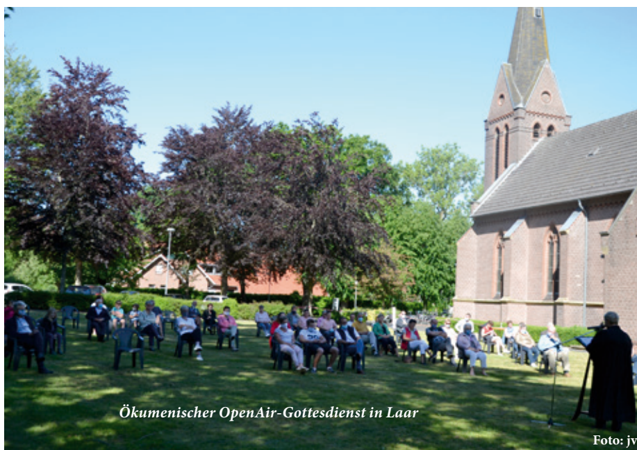
Ökumenischer OpenAir-Gottesdienst in Laar