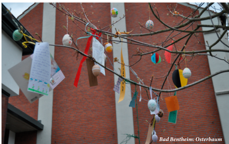
Bad Bentheim: Osterbaum

In Zeiten von Corona konnten wir als Gemeinde sehr von der Aktivität der Ältesten und Kirchenratsmitglieder profitieren, die einen Gemeindebrief als Ostergruß in alle Haushalte brachten. Das erlebten viele gerade in den ersten Wochen als Zeichen einer besonderen Verbundenheit. Das hat sich zu Pfingsten wiederholt und wird vorerst zu Beginn jedes neuen Monats fortgesetzt mit den regulären Gemeindebriefen. Als schwierig erwies sich für den Kirchenrat, nicht zusammenkommen zu können. Dies dauerte bis zum 9. Juni. Bei 25 Personen hat