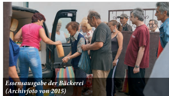
Essensausgabe der Bäckerei (Archivfoto von 2015)

Dort unterstützt auch die Diakonie unserer altreformierten Kirche eine Diakoniestation, die vielen Flüchtenden zur Hilfe kommt. Dieser Diakoniestation haben wir über die synodale Diakoniekasse eine Ersthilfe in Höhe von 1500 Euro zukommen lassen. (sva)