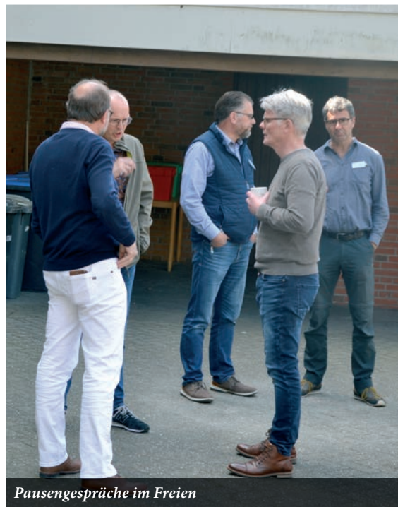
Pausengespräche im Freien