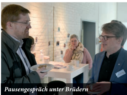
Pausengespräch unter Brüdern