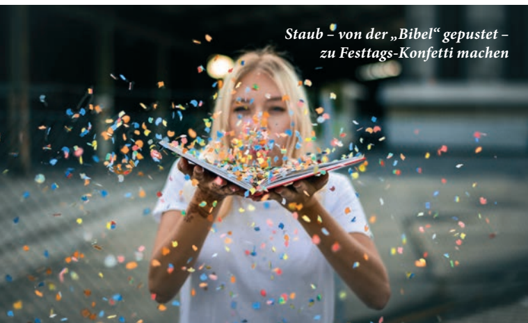
Staub – von der „Bibel“ gepustet – zu Festtags-Konfetti machen

Zuerst wirkt Gottes Geist seinerzeit in Jerusalem als ein plötzliches „Brausen, wie wenn ein heftiger Sturm daher fährt“, „Zungen wie von Feuer“ erscheinen, die sich verteilen und auf