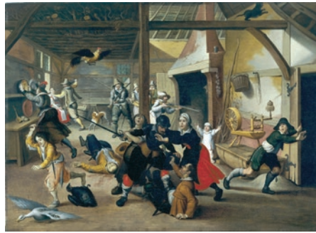
„Plünderung im Dreißigjährigen Krieg“ – Sebastian Vrancx (1573–1647), Deutsches Historisches Museum Berlin

Der Glaubende soll spüren, dass auch sein Leiden sinnerfüllt ist. Auch wenn sich uns der Grund oft nicht erschließt, wir vielleicht verzweifelt oder zornig Gott fragen möchten, gilt es doch das Vertrauen nicht zu verlieren: Gott ist bei uns