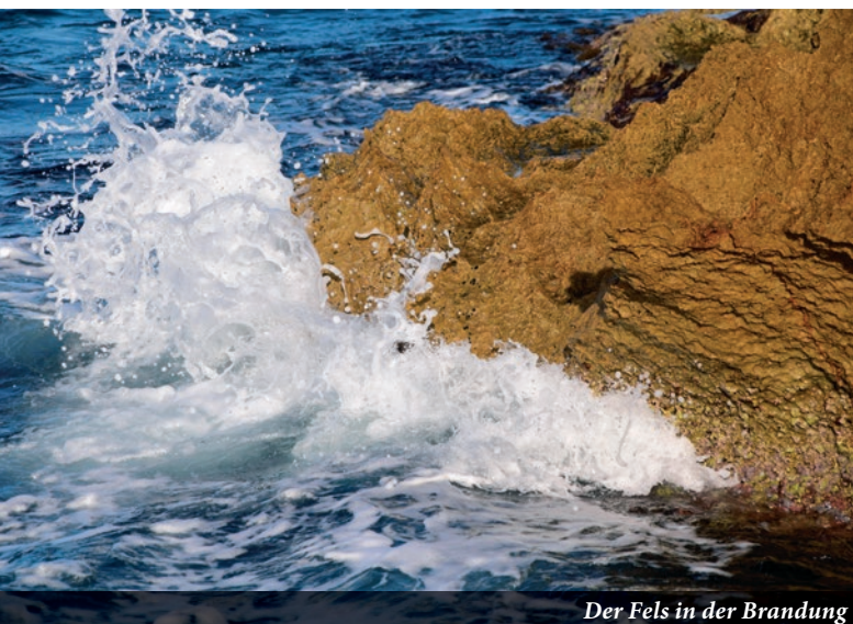
Der Fels in der Brandung