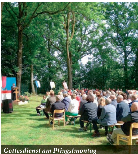
Gottesdienst am Pfingstmontag