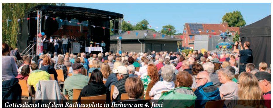
Gottesdienst auf dem Rathausplatz in Ihrhove am 4. Juni