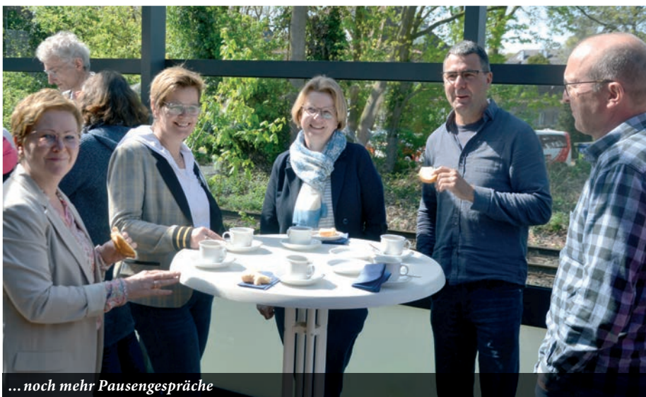
... noch mehr Pausengespräche

In der Nordhorner Gemeinde gab es bauliche Veränderungen innerhalb der Kirche.