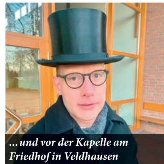
... und vor der Kapelle am Friedhof in Veldhausen